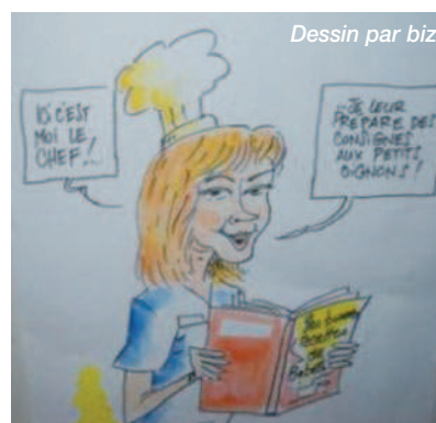
Dessin par biz

Cette ouverture donne de premières pistes et ces expériences ont pu améliorer le quotidien.