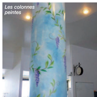
Salle d'hémodialyse et colonnes

A l'entrée de la salle de dialyse, se trouvent des dessins réalisés par Blz, dessinateur (cf. point concernant les dessins). Dans le couloir, on retrouve des photographies des membres de l'équipe lorsqu'ils étaient enfants. De plus sur les portes, des stickers colorés sont posés. L'idée est d'égayer l'aspect des locaux.