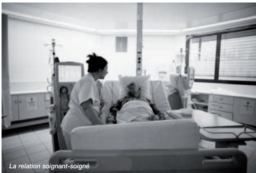
La relation soignant-soigné

Nous avons acheté un lecteur de DVD. A ce jour, les téléviseurs ne sont pas équipés de lecteur de dvd Les patients ont un écran pour 2 et ont accès à de multiples chaînes.